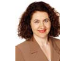
Marianne Erdin, Medizinerjournalistin, ehemalige Moderatorin PULS, SF